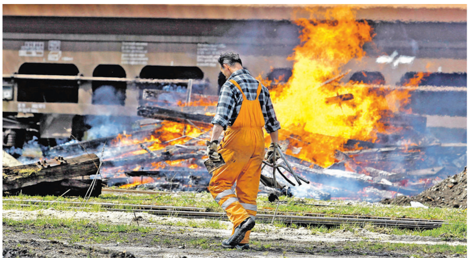
LEPE OBLJUBE LEPO GORIJU