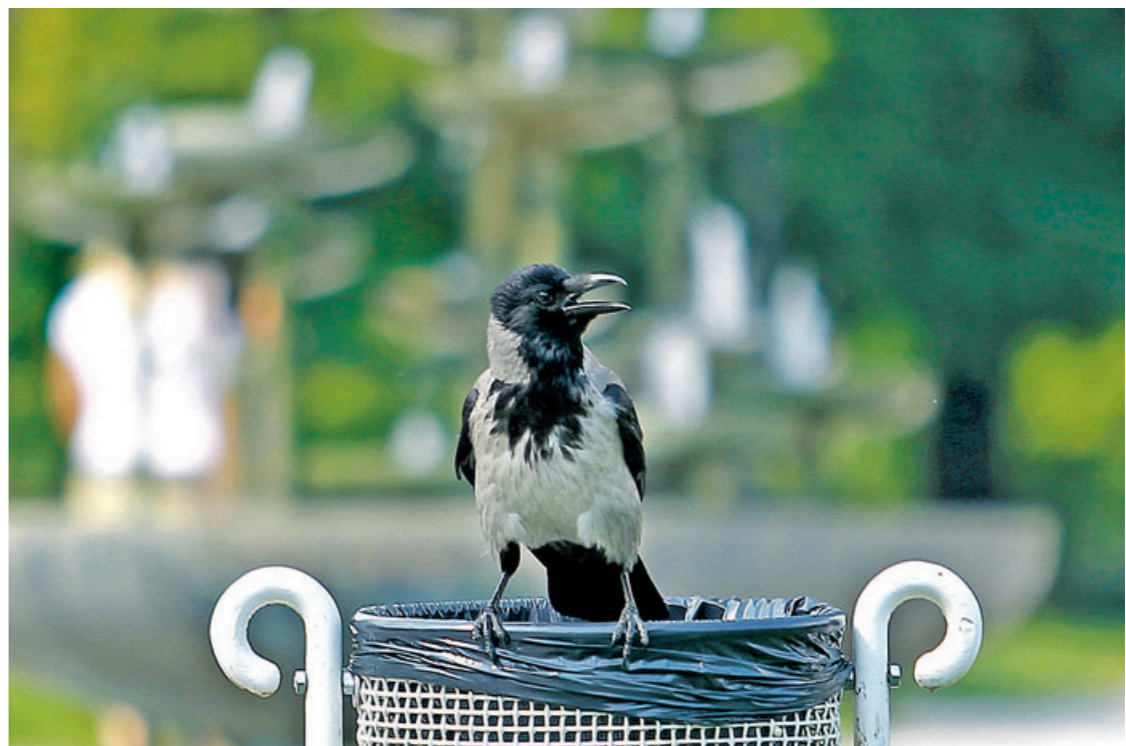
VRANE NA SMETEH

LJUBLJANA – Vrane kot uspešne živali, ki so si v mestu naše gostoljubno okolje, v vsakim letom postajajo številnejše in za prebivalce bolj moteče. Poleg tega, da občasno napadejo ljudi, ker branijo svoje mladiče, lovci opozarjajo tudi, da ubijajo manjše ptice, hkrati pa jih na nelovnih območjih, med katera namreč spada glavno mesto, ne smejo ubijati.