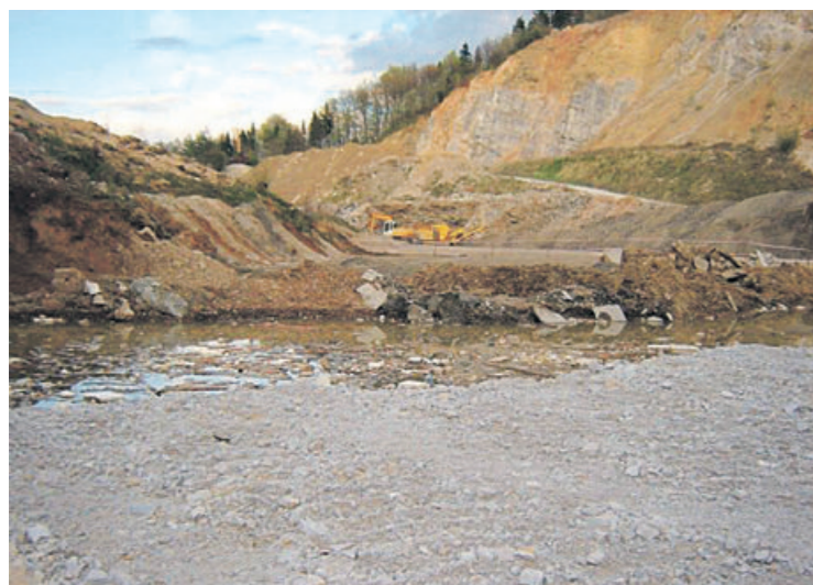
KAMNOLOM SOSTRO – Krajanje bi ga radi zaradi nadležnega hrupa, prahu, tovrnoga prometa in ogrožanja lokalnih vodovodov čim prej zaprli, KPL pa bi ga širil in na njem odprl celo novo betonarno obrat za liti asfalt.

Rudarski inšpektor Simon Friškovec je povedal, da je 15. aprila opravil nadzor v kamnolomu Sostro, potem ko mu je konec marca prijavo odstopila okoljska inšpekcija. Iz poročil o vplivih rudarjenja na kakovost vode je razbral, da miniranje občasno povzroča kalnost vode v dveh vrtinah in da vrtina Sadinja vas, ki je bila izdelana leta 2005 in bi nadomestila obstoječi dve, ni priključena na vodovod, ker zanj še niso pridobili vodne pravice. Edina nepravilnost, ki jo je odkril, je, da KPL nima izdelane tehnične dokumentacije za odvodnjavanje meteorne vode iz kamnoloma, ki občasno zastaja na osnovnem platuju. Zato je podjetje izdal odločbo, da jo mora pridobiti do konca junija, nato mora slediti izvedba kanala za odvodnjavanje.